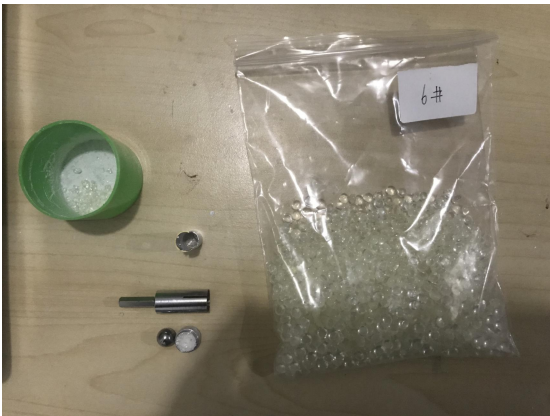
树脂样品装入 6.35mm 脂杯

样品的前处理：取本品适量，软化点测定多为固体快状样品，需要打碎后再容器内加热熔化，不要用明火。同时在加热的过程中不断搅拌，在较高温度下使样品内水分去除，直到样品不在有起泡现象。脂杯在铜板上预热一下，然后倒入融化的样品，直至溢出，待样品冷却凝固后，用过热的刮刀将表面烫平。不要让脂杯内产生空隙或气泡。